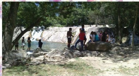
Actividad realizada en Agosto 2015